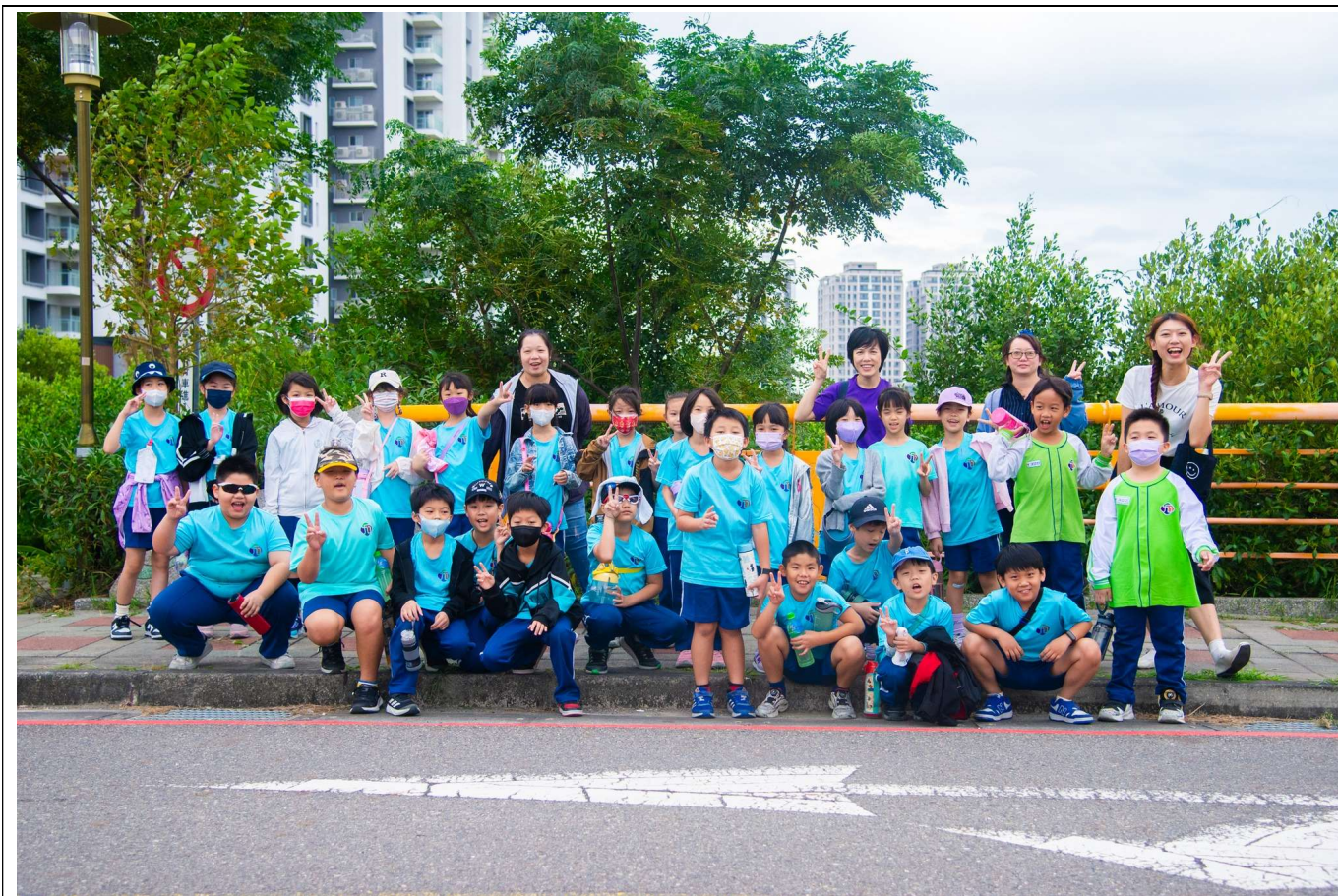
二、舉辦越野定向活動，讓學生更理解交通號誌