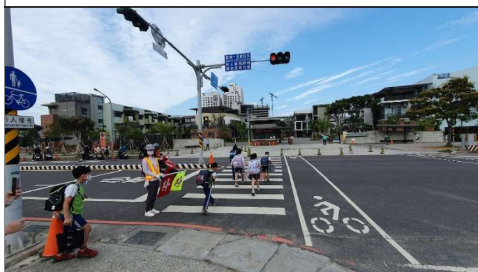
校門口導護—行人綠燈走斑馬線