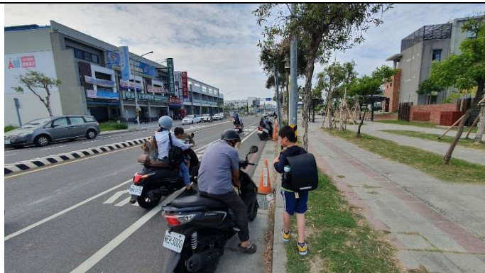
校門口導護—機車暫停區引導