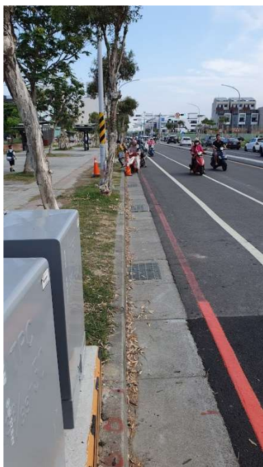
校門口導護—機車暫停區引導