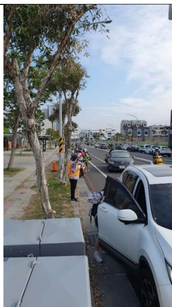
交通導護執行--校門口人車分流管制