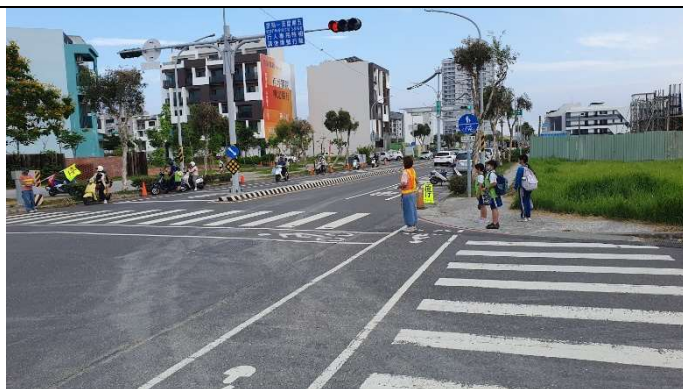
校門口導護—行人等候綠燈