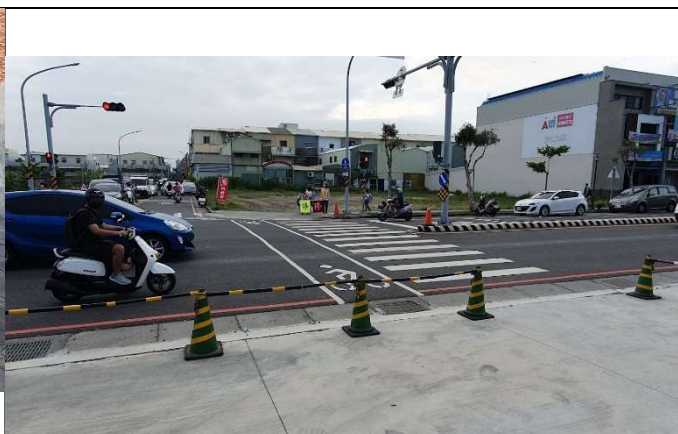
校門口導護—行人等候綠燈