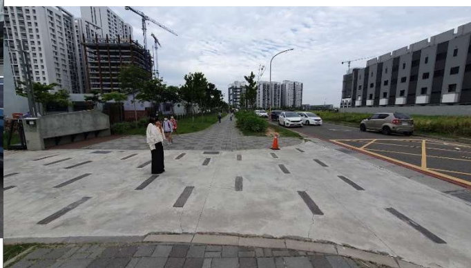
繪製黃網線後交通狀況改善