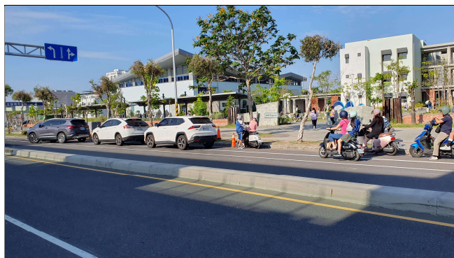
家長接送汽機車分區暫停