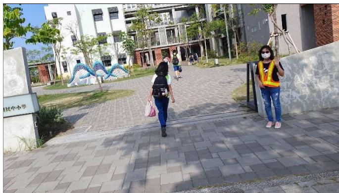
交通導護執行—側門管制