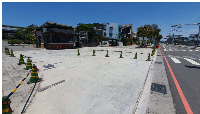
校門口車道前停車標誌