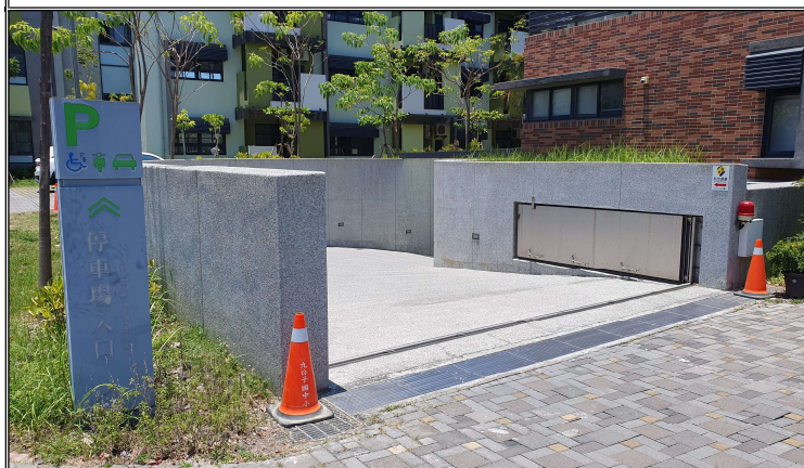
停車場出入口注意標誌