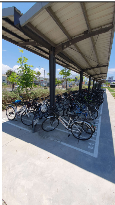
校門口勿停車管制