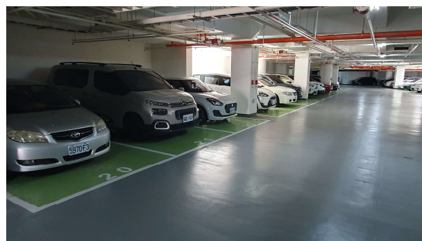
停車車頭全數朝外確保行人安全