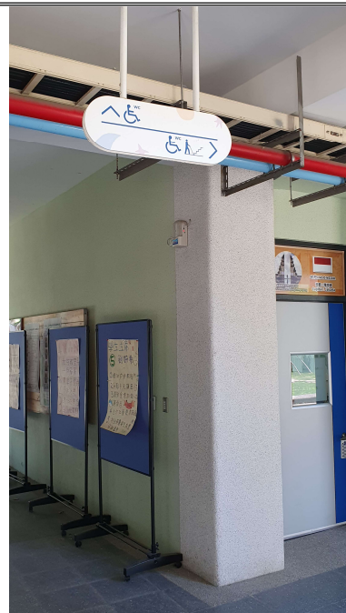
無障礙廁所、無障礙樓梯標誌