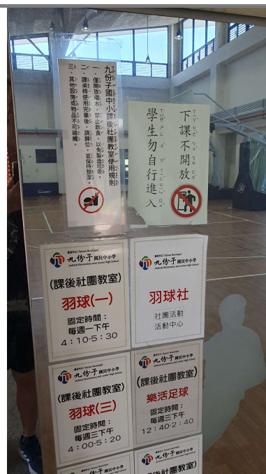
活動中心使用規則