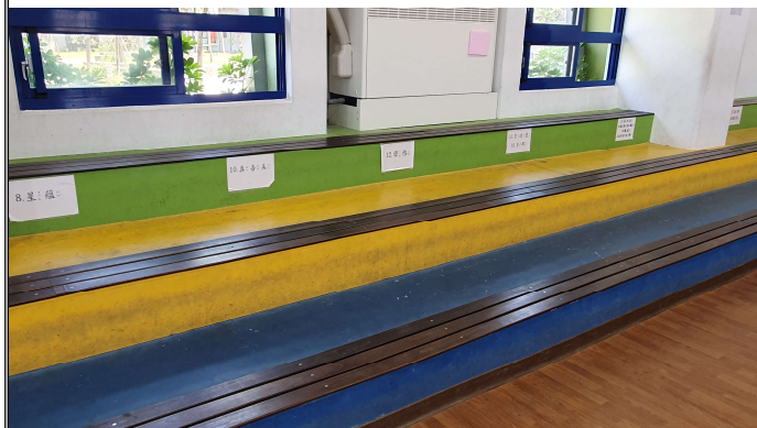
國小放學路隊編組