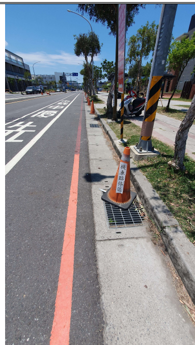
校門口勿停機車標誌