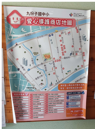
愛心商店地圖海報