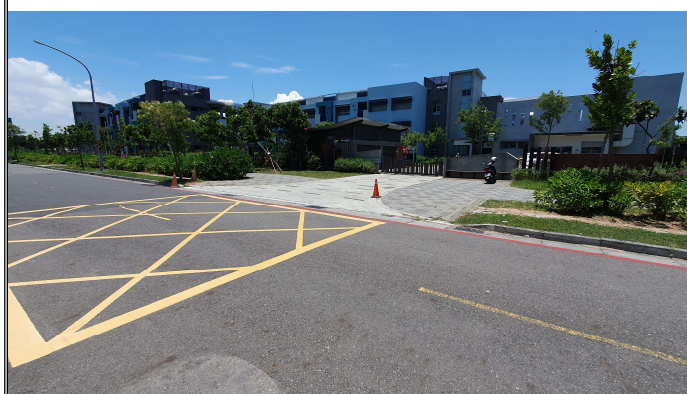
側門申請黃色網狀線與紅線