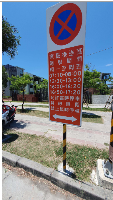
上放學時間臨停標誌